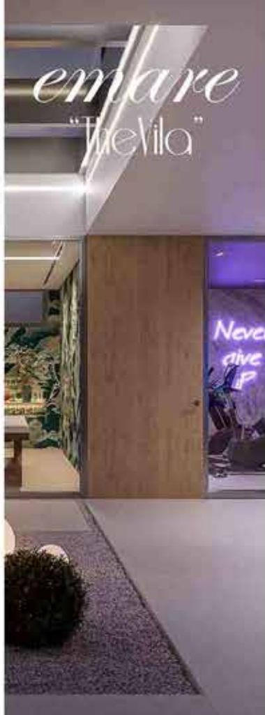
Memoria de Calidades. SOTA a renovar eléctrica sin bajar su nivel de calidad.