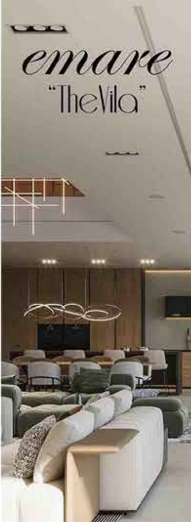
Memoria de Calidades puerta a receptor blanca sin bajar su nivel de calidad.