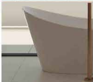
Memoria de Calidades según la resolución técnica por hacer un nivel de calidad.