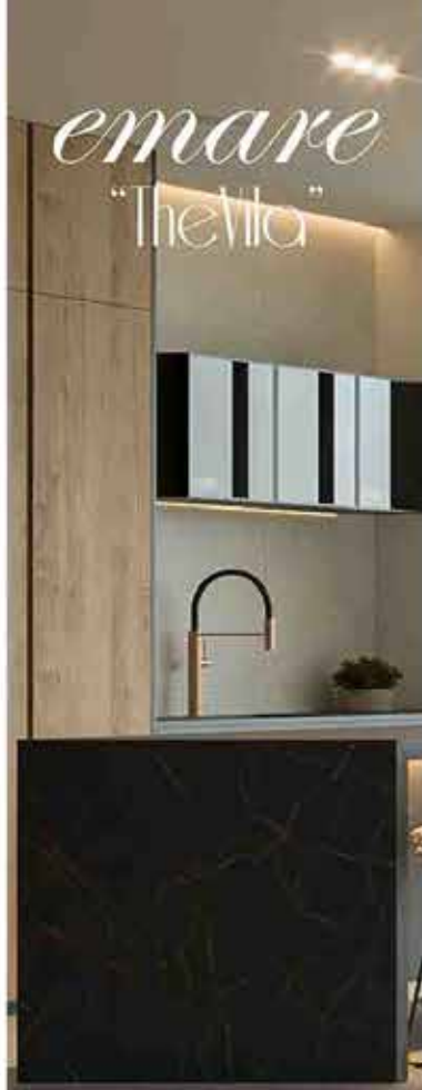
Memoria de Calidad para el sector B2C en el sector de Cerámica

• Plato de ducha flotante y totalmente enrasado a la solería de la vivienda, realizado del mismo material porcelánico que la solería de la vivienda, en su versión antideslizante, de formato rectangular, desagüe a través de las juntas y medidas adaptadas al diseño.